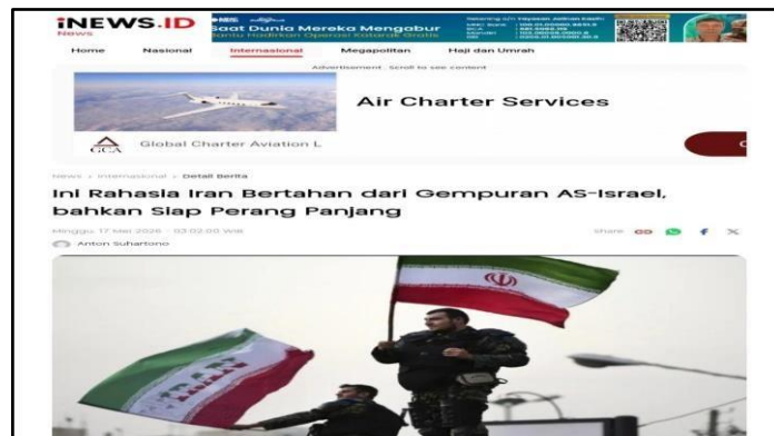
Gambar 2. Rahasia Ketahanan Iran Hadapi Gempuran AS-Israel

Pada pemberitaan lain dari iNews berjudul “ Rahasia Ketahanan Iran Hadapi Gempuran AS-Israel ”, Iran digambarkan tidak hanya sebagai aktor militer, tetapi juga sebagai negara yang memiliki kemampuan bertahan dalam tekanan geopolitik yang kompleks. Judul tersebut beralih fokus dari sekadar konflik militer, narasi, ketahanan, dan strategi pertahanan jangka panjang.