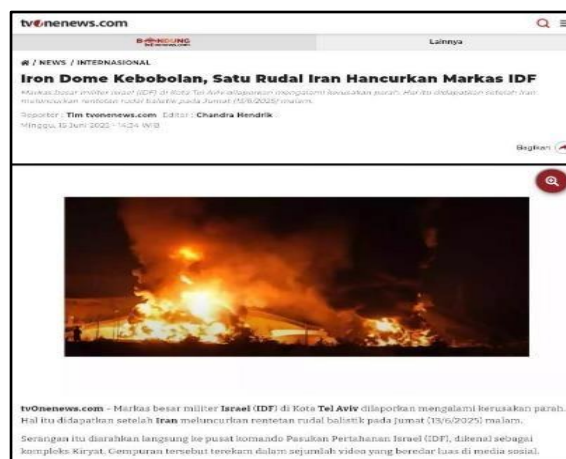
Gambar 3. Iron Dome Kebobolan Dalam Serangan Iran Terhadap Israel

Sementara itu, pemberitaan tvOne berjudul “ Iron Dome Kebobolan dalam Serangan Iran terhadap Israel ” menampilkan konstruksi berbeda dengan penekanan keberhasilan serangan Iran menembus sistem pertahanan Israel. Fokus pada “Iron Dome Kebobolan” tidak hanya menggambarkan aspek teknis militer, tetapi juga menciptakan makna simbolik tentang melemahnya sistem pertahanan lawan.