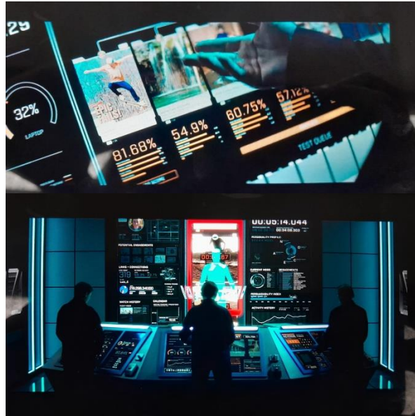
Gambar Scene menit 12:20-13:44

Salah satu adegan paling kunci dalam film adalah penjelasan tentang model bisnis media sosial pada menit [12:20-13:44]. Dalam adegan ini, seorang investor di bidang teknologi menjelaskan: "For the last ten years, biggest company in Silicon Valley do the business with selling the uses. Advertisers pay for the product that we use, advertisers are the customers. We're the one that being sold" . Pernyataan ini dipertegas dengan tampilan layar hitam yang menampilkan kalimat: "If you're not paying for the product, then you are the product" , dengan kata "you are the product" ditekankan dalam warna berbeda.