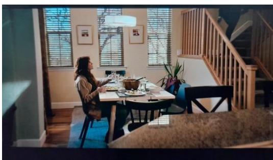
Gambar Scene menit 34:03-34:13

Eksploitasi Data sebagai Komoditas Utama: Film dengan jelas menunjukkan bahwa data pengguna bukan sekadar informasi, melainkan komoditas berharga yang diperdagangkan. Setiap klik, "like", dan interaksi dikumpulkan, dianalisis, dan dimonetisasi. Seperti yang diungkapkan dalam adegan wawancara, perusahaan teknologi tidak menjual produk kepada pengguna mereka menjual pengguna itu sendiri kepada pengiklan.